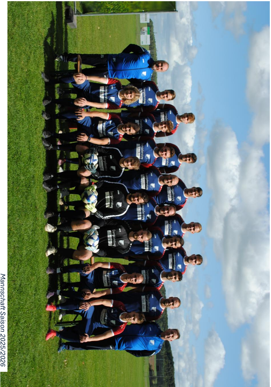
Mannschaft Saison 2025/2026