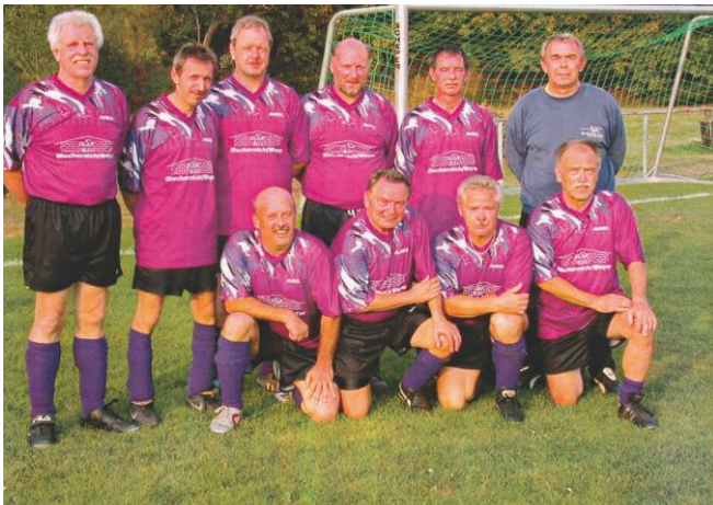
Mannschaft Kreismeisterschaft 2006