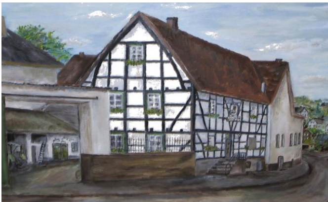
Gasthaus Schruff • Bahnhofstr. 4 • 53947 Nettersheim